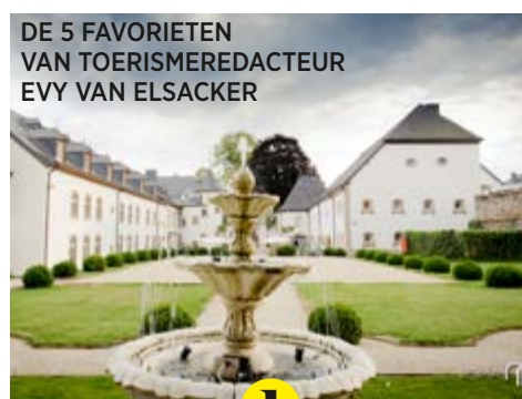
DE 5 FAVORIETEN VAN TOERISMEREDACTEUR EVY VAN ELSACKER

Heeft onze citytripsspecial je geïnspireerd? Onze redacteur selecteert onze 5 favoriete hotels, waar je met de MyHotelCard overnacht, mét korting. Maar test er vooral zo veel mogelijk zelf uit!